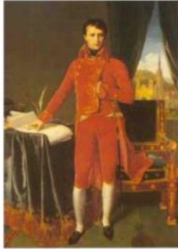
INGRES (1780-1867) "Bonaparte Premier Consul" (1804)

Cette peinture a été réalisée par Ingres en 1804. Il s'agit d'un portrait de Napoléon Bonaparte. C'est une peinture figurative.